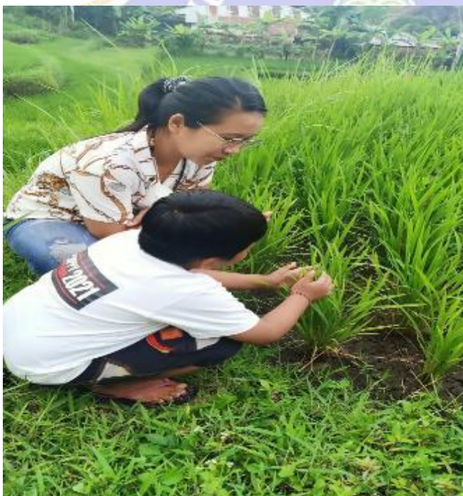
The process of Virtual Field Trip program