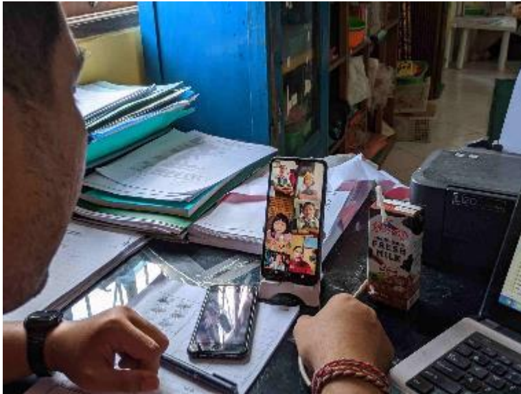
The Process of Online Learning