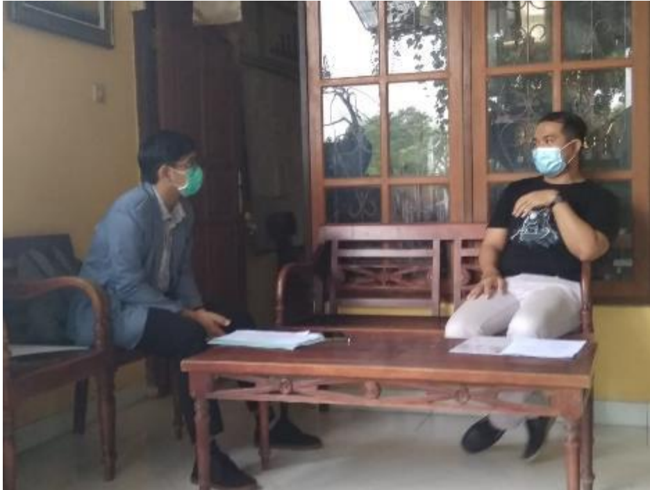
Interview with school headmaster.