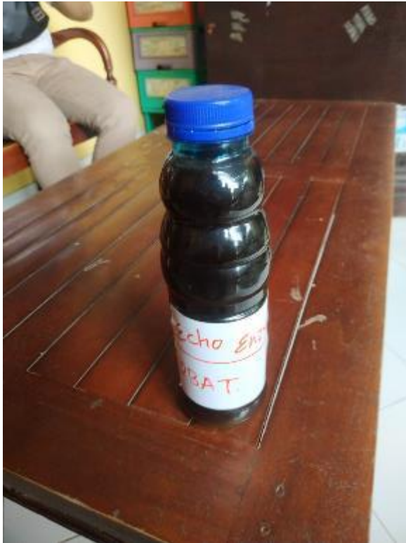
The result of eco-enzyme