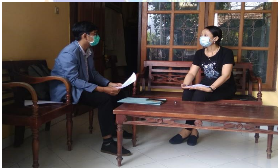
Interview with Grade B Teachers.