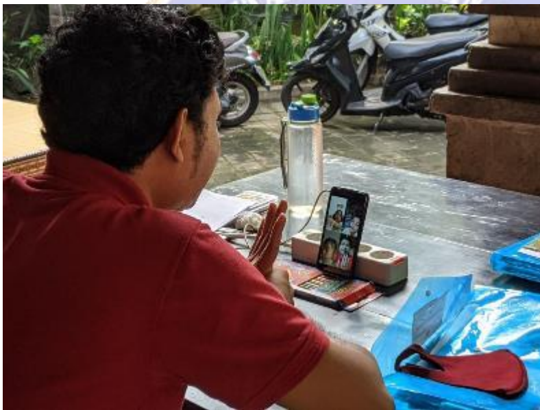
The Process of Online Learning