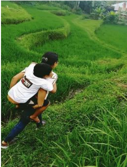
The process of Virtual Field Trip program