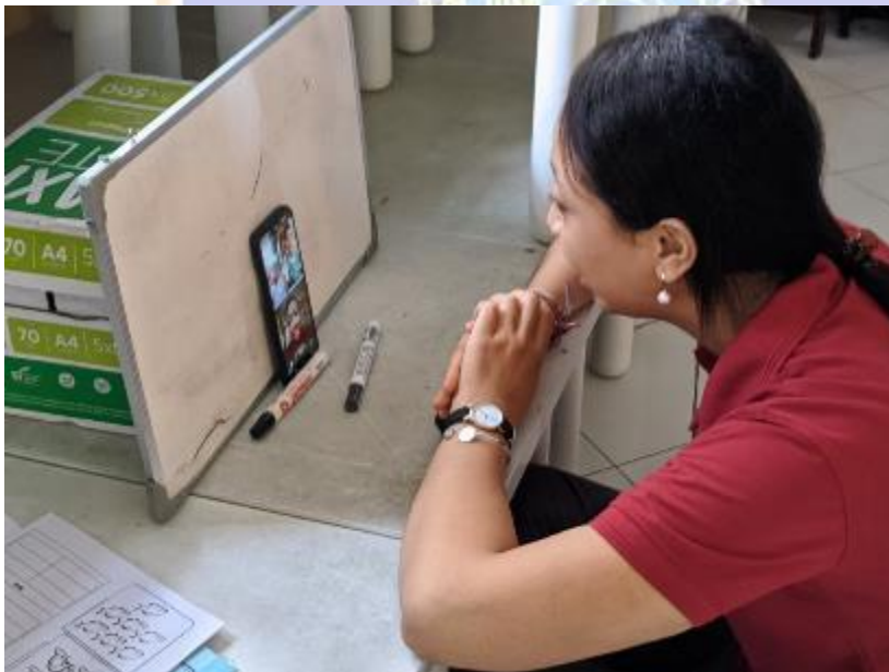
The Process of Online Learning