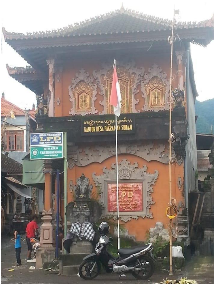
Gambar 2. LPD Desa Sudaji