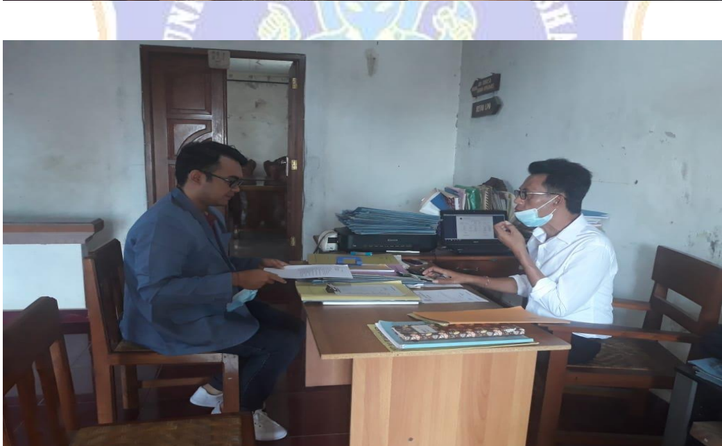
Gambar 1. Observasi LPD Desa Sudaji