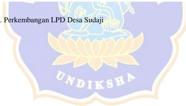
Gambar 2. Perkembangan LPD Desa Sudaji