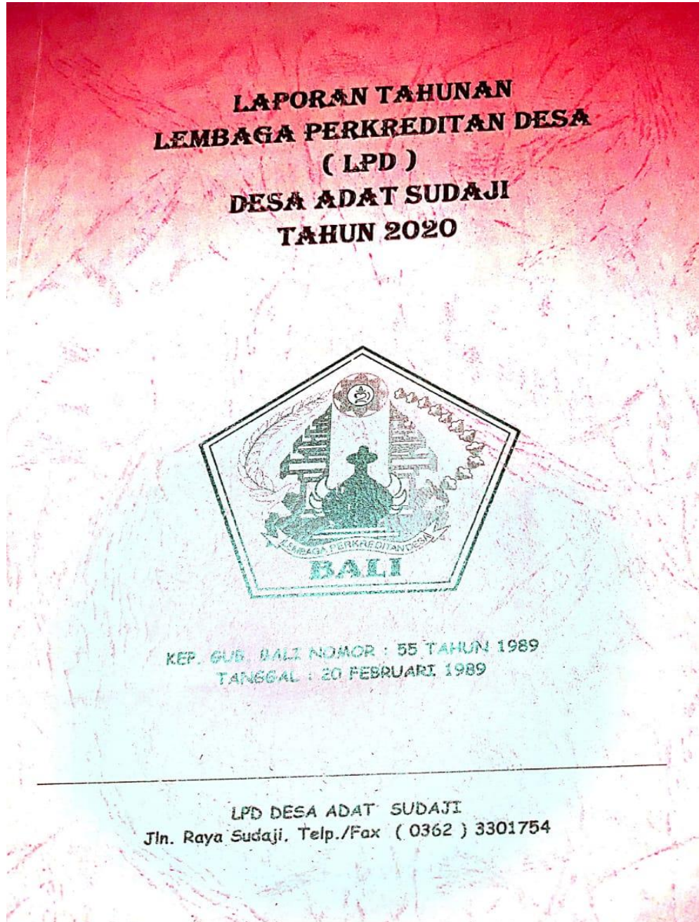
Gambar 1. Laporan Tahunan LPD Desa Sudaji