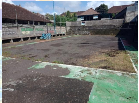
Lapangan Bola Voli