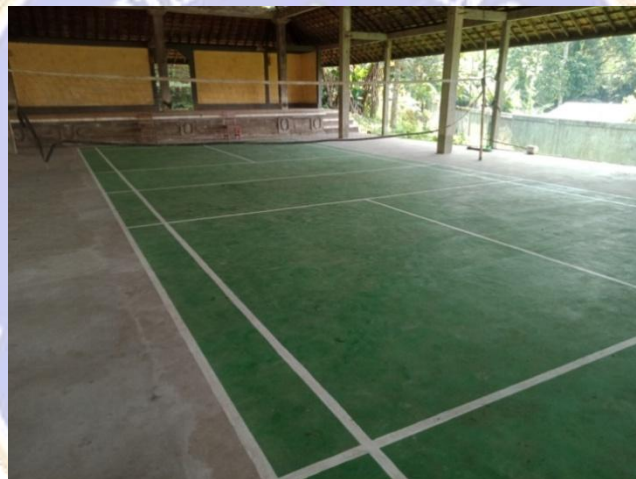
Lapangan Bola Basket dan Voli