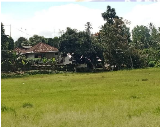
Lapangan Sepak Bola