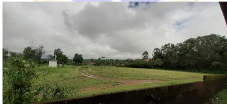
Lapangan Sepak Bola