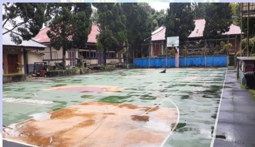
Lapangan Basket dan Voli