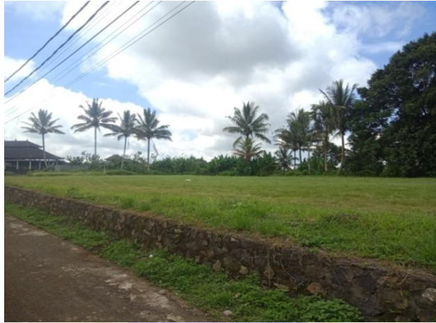
Lapangan Sepak Bola