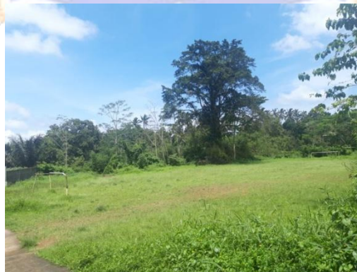
Lapangan Sepak Bola