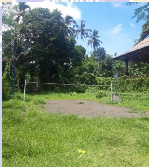
Lapangan Bola Voli