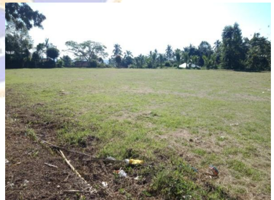
Lapangan Sepak Bola