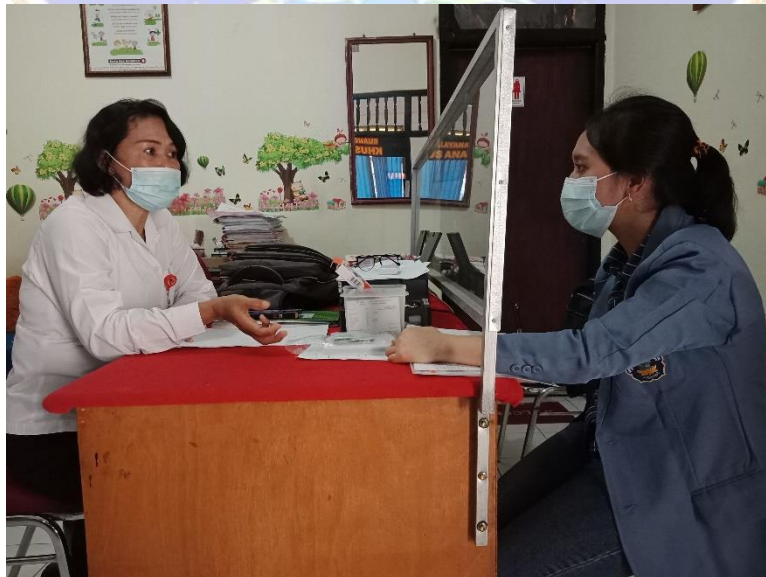
WAWANCARA DENGAN NARASUMBER II