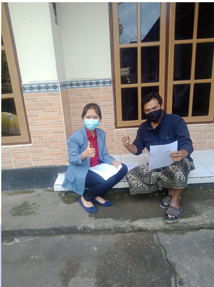
WAWANCARA DENGAN TOKOH MASYARAKAT