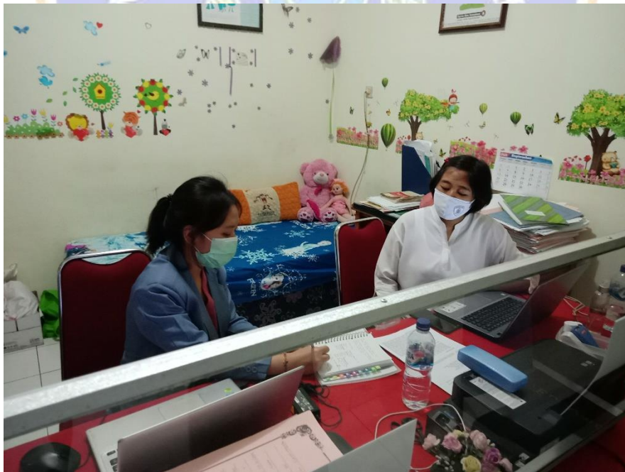
WAWANCARA DENGAN NARASUMBER IV