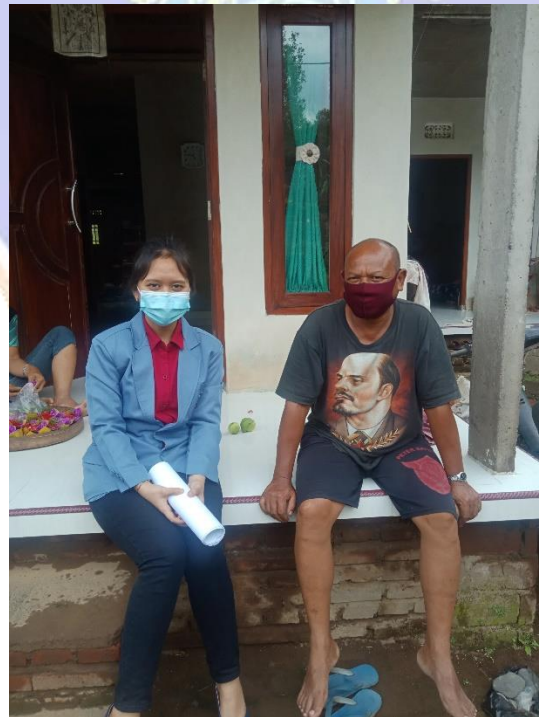
WAWANCARA DENGAN KORBAN