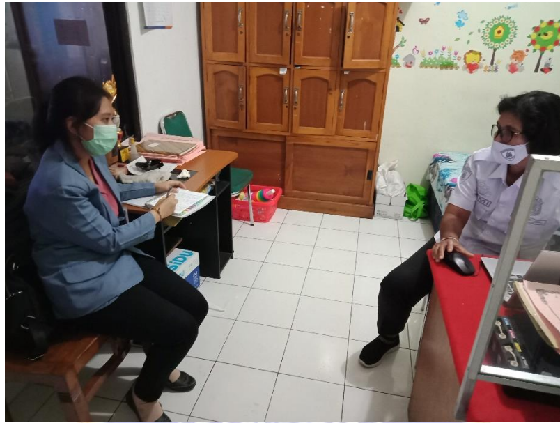
WAWANCARA DENGAN NARASUMBER III