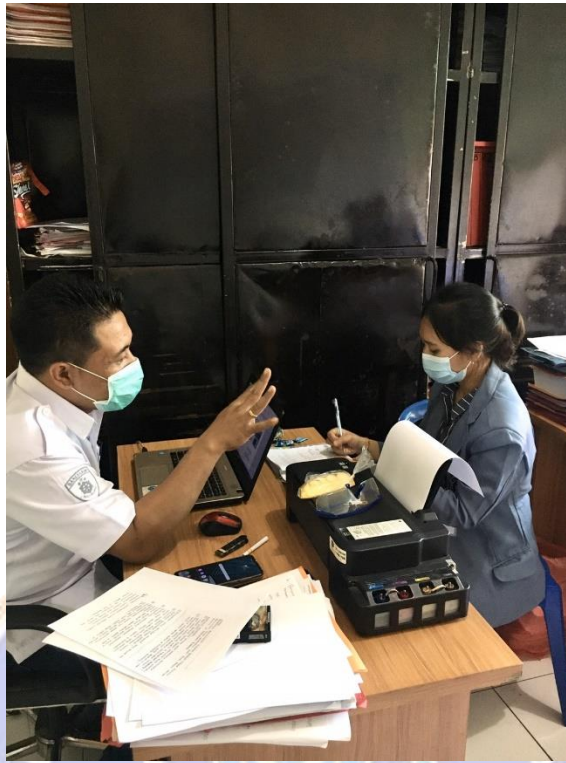
WAWANCARA DENGAN NARASUMBER I