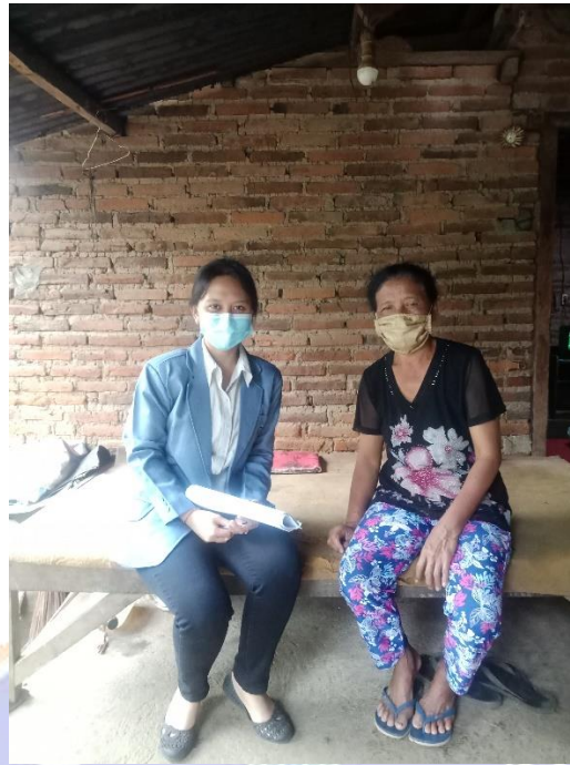
WAWANCARA DENGAN ORANG TUA ANAK