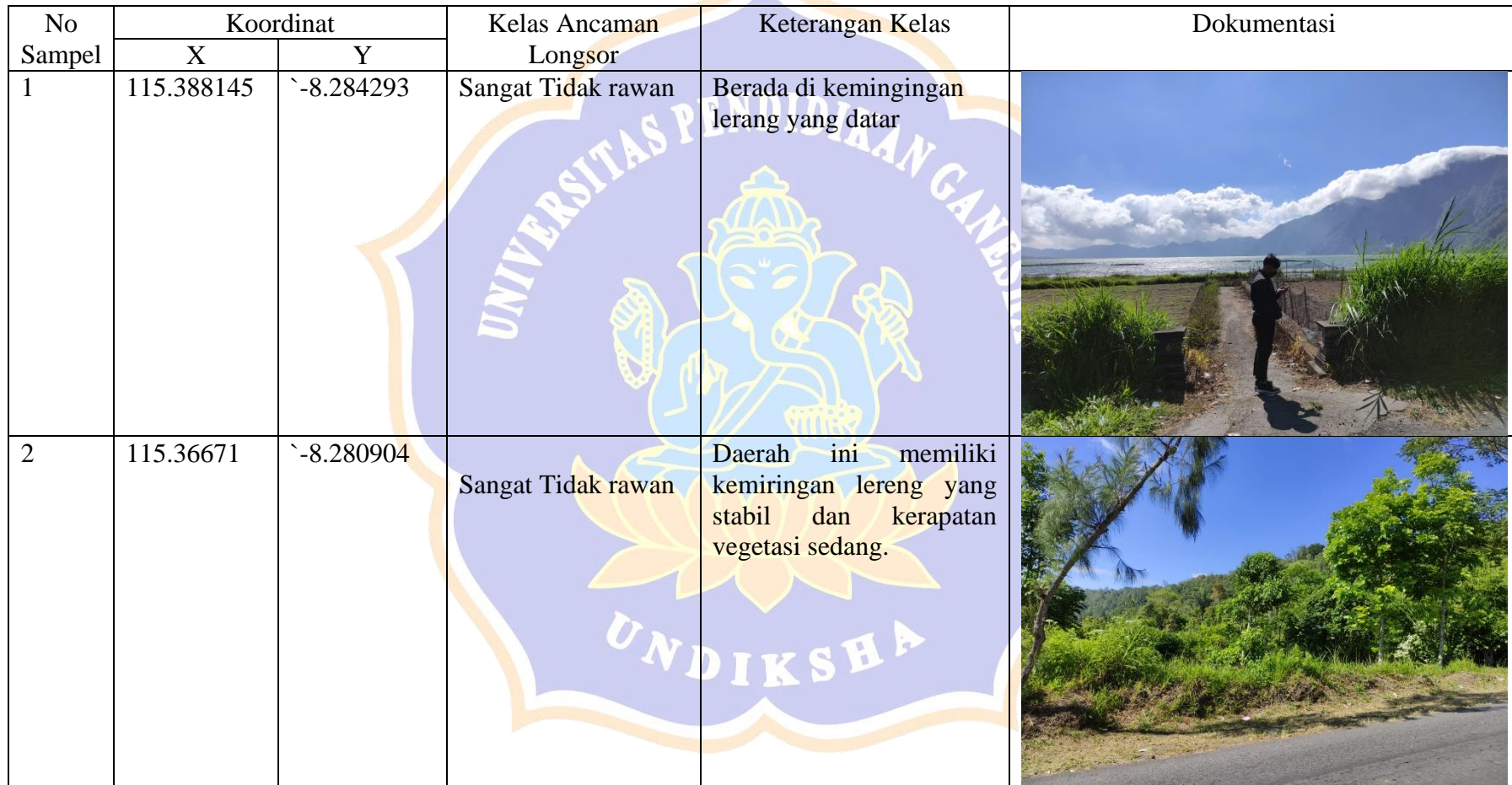
Tabel 2 Daftar titik sampel per klasifikasi potensi ancaman bencana tanah longsor di Kecamatan Kintamani