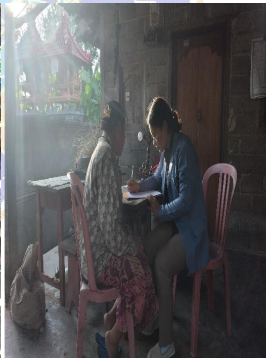
Gambar Informan Utama 4