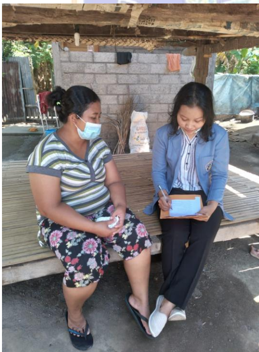
Gambar Informan Utama 3