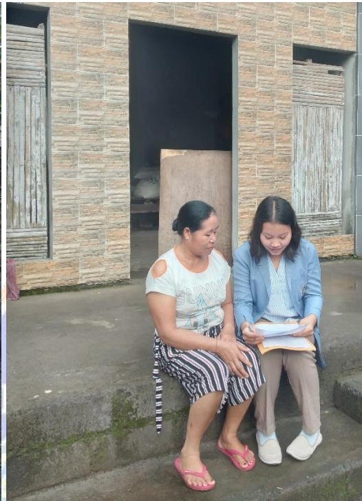
Gambar Informan Utama 2