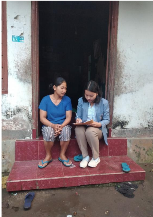
Gambar Informan Utama 5