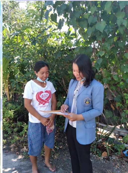
Gambar Informan Utama 8