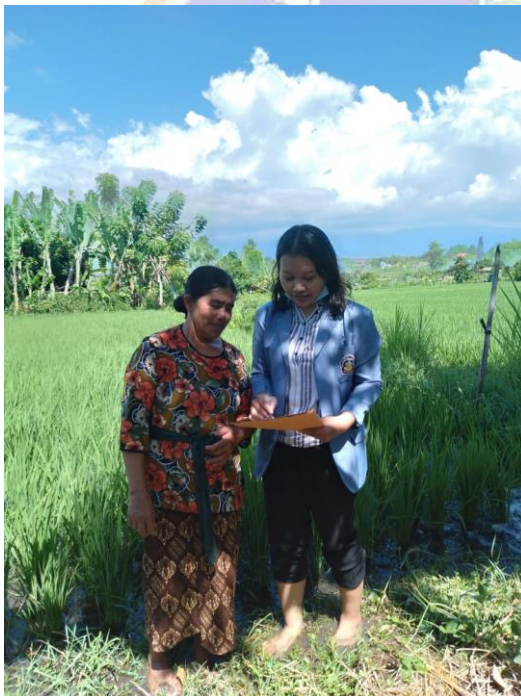
Gamabar Informan Utama 7