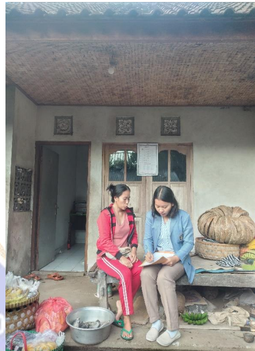
Gambar Informan Utama 6