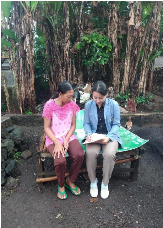
Gambar Informan Utama 1