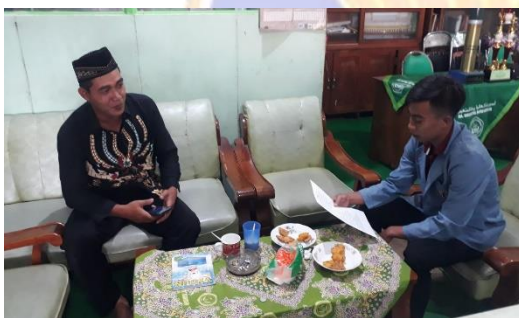
Wawancara dengan Waka Kesiswaan