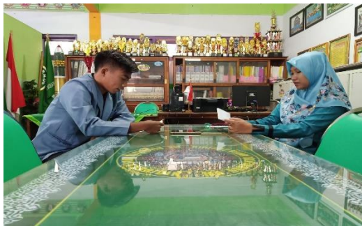
Wawancara dengan Guru Bk