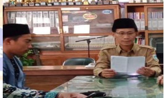
Wawancara dengan Wakakurikulum