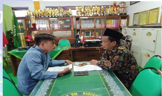
Wawancara dengan Kepala Sekolah