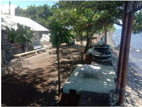
4. Warung Lesehan