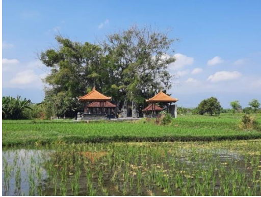
2. Pura Alit Penarukan