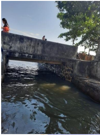
3. Soan Pantai Penarukan