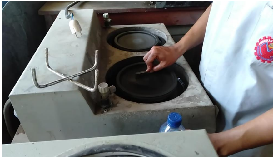
Proses pengamplasan spesimen sebelum di uji vickers