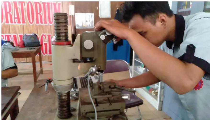
Proses uji vickers