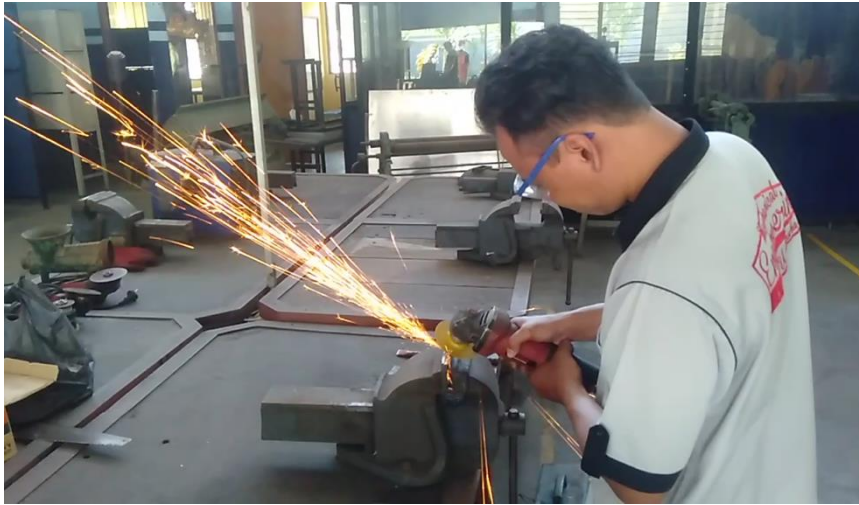
Proses gerinda pembuatan kampuh V