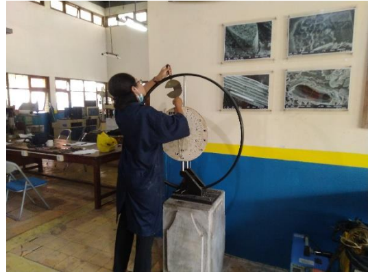
Proses Pengkalibrasian Alat