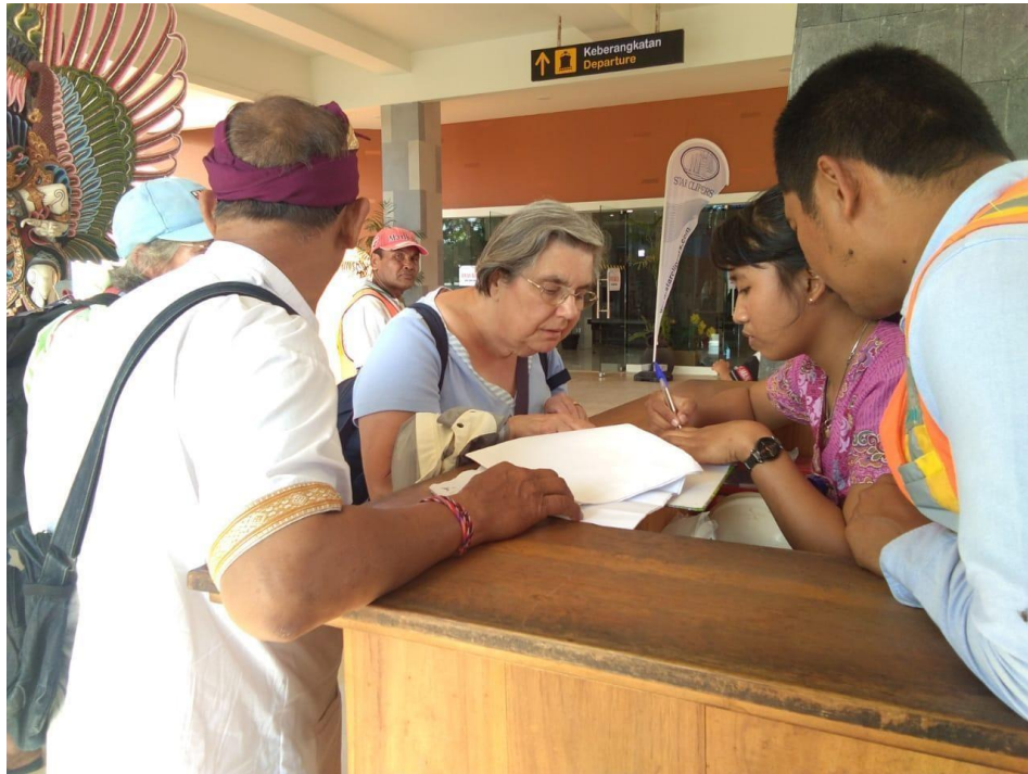
Registrasi passengers cruise ship