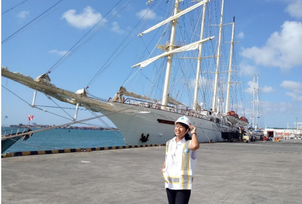
Dermaga Timur PT. Pelindo III Cabang Benoa