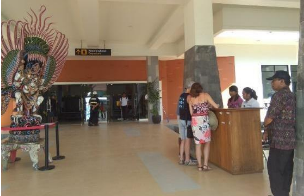
Outside Benoa Cruise Terminal PT. Pelindo III Cabang Benoa