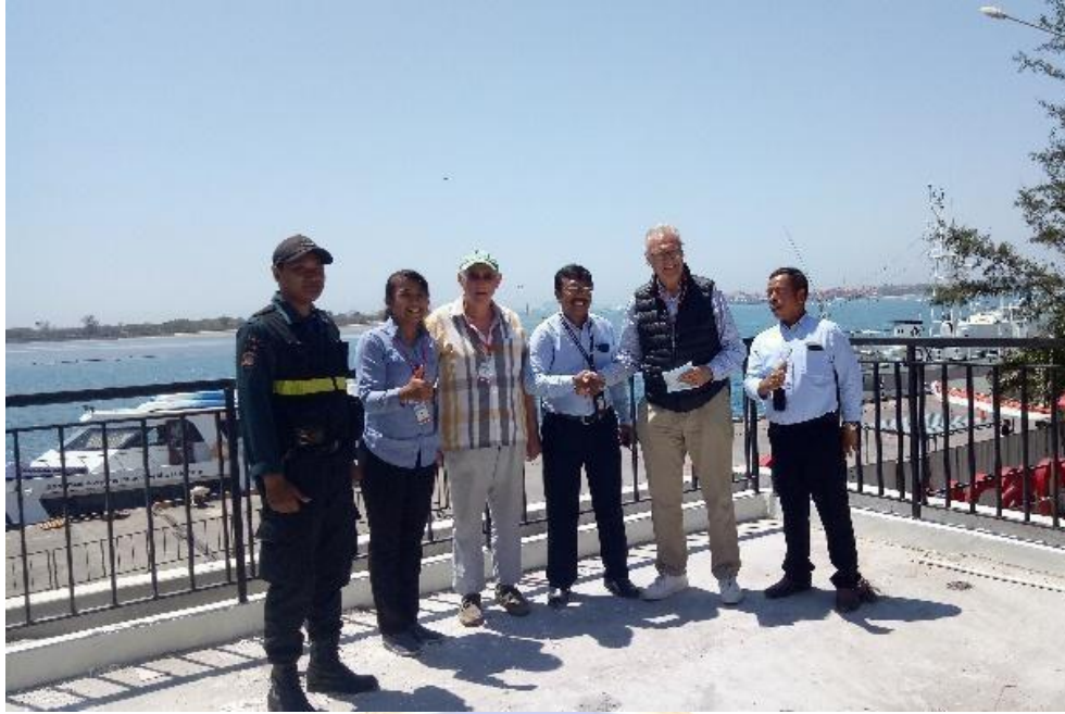
Pelayanan Informasi Kepada AgenShip