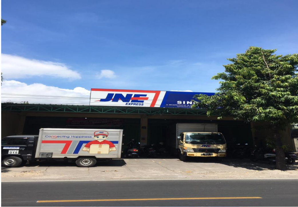
Lokasi Penelitian di JNE Espress Singaraja, Buleleng Bali