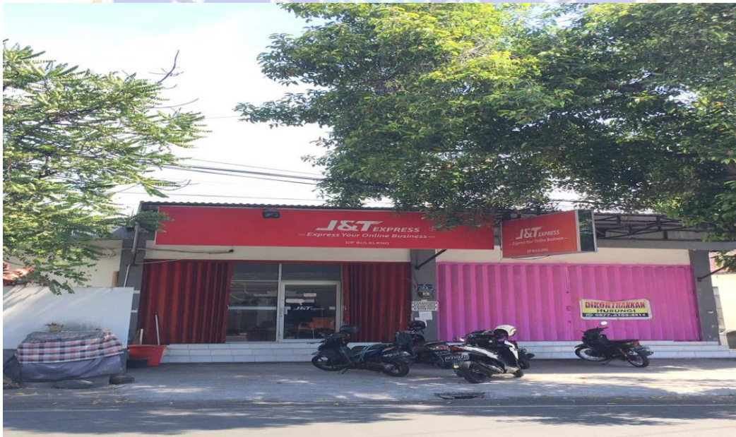
Lokasi Penelitian di J&T Express Singaraja, Buleleng Bali