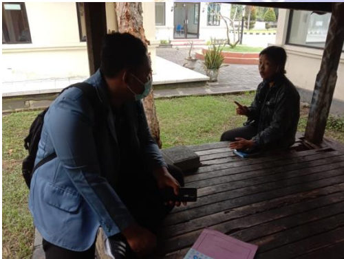
Wawancara Kepada Beberapa Konsumen