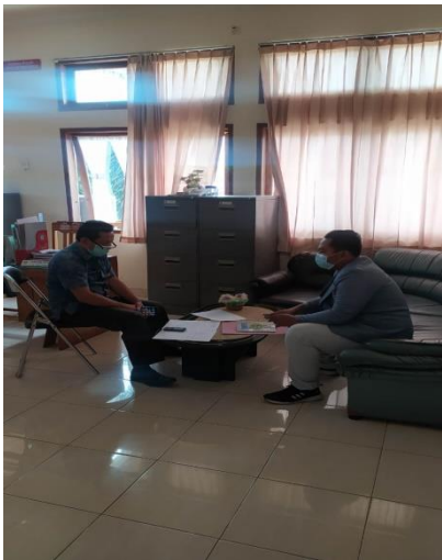
Wawancara ke Pihak SPBU