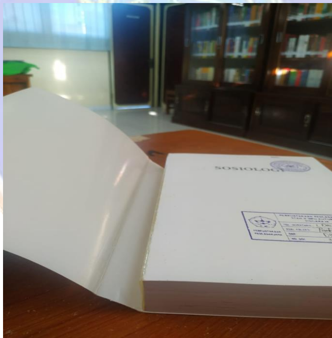
Bahan pustaka yang rusak disebabkan oleh faktor manusia