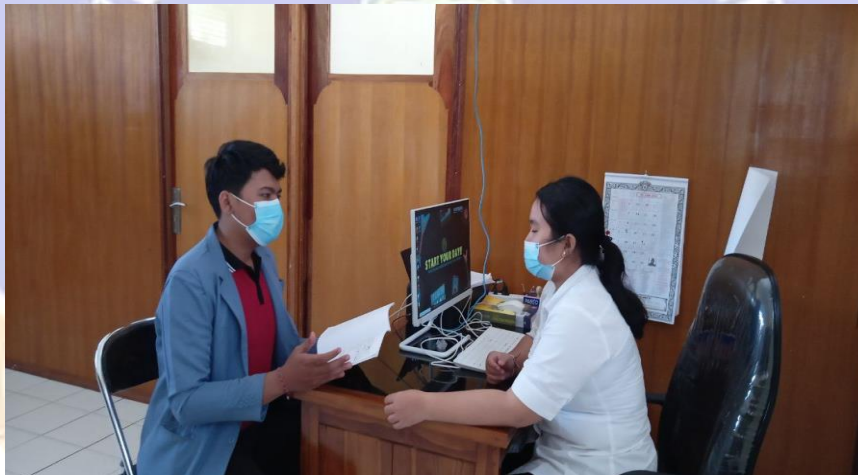
Kegiatan wawancara dengan pustakawan bidang pengelola Perpustakaan Pascasarjana