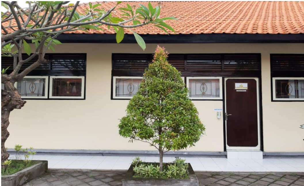
Gedung Perpustakaan Pascasarjana STAHN Mpu Kuturan Singaraja