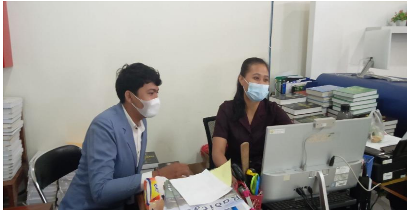
Kegiatan wawancara dengan pustakawan bidang pengadaan dan pengolahan bahan pustaka