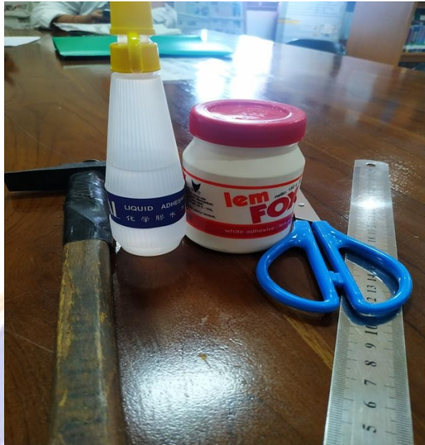
Peralatan yang digunakan untuk kegiatan preservasi atau pelestarian