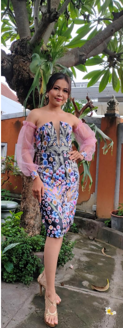
Lampiran 09. Dokumentasi Pelaksanaan Uji Produk