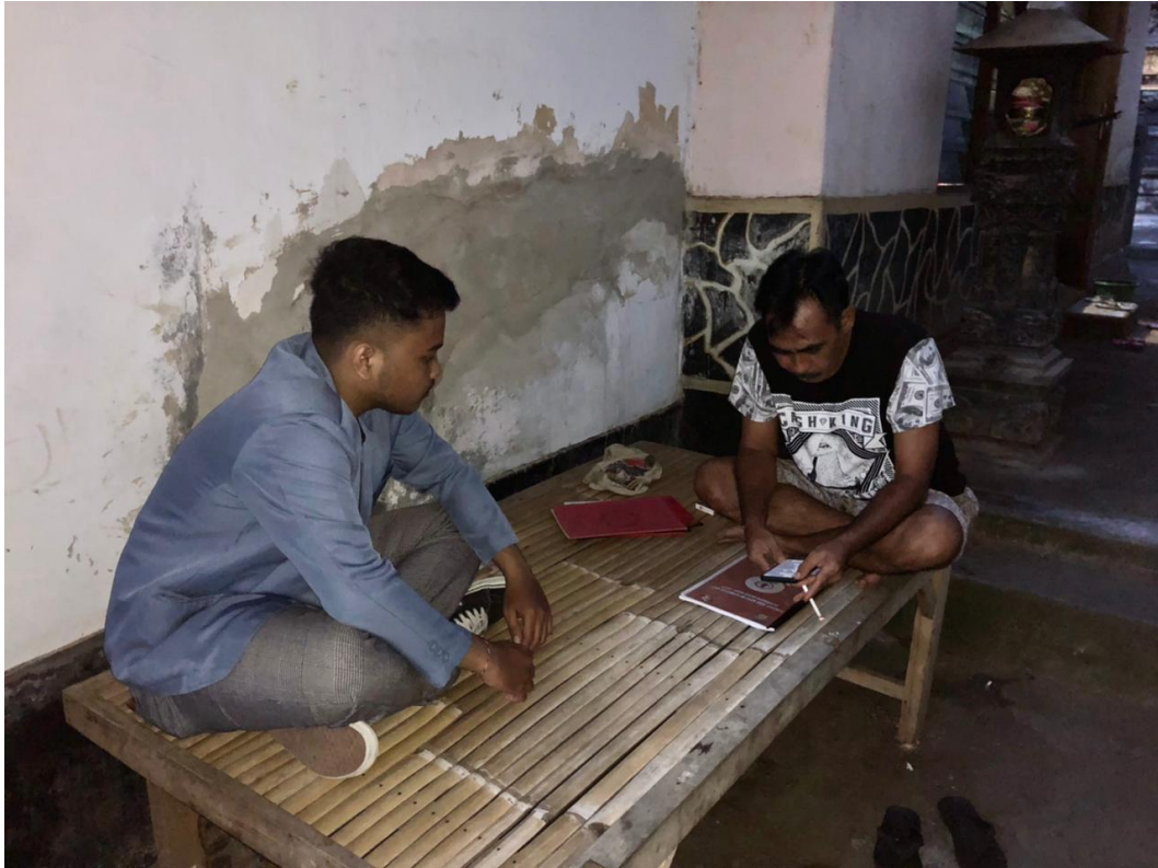
Gambar 3. Observasi dan Wawancara dengan Tata Usaha LPD Desa Adat Bukti