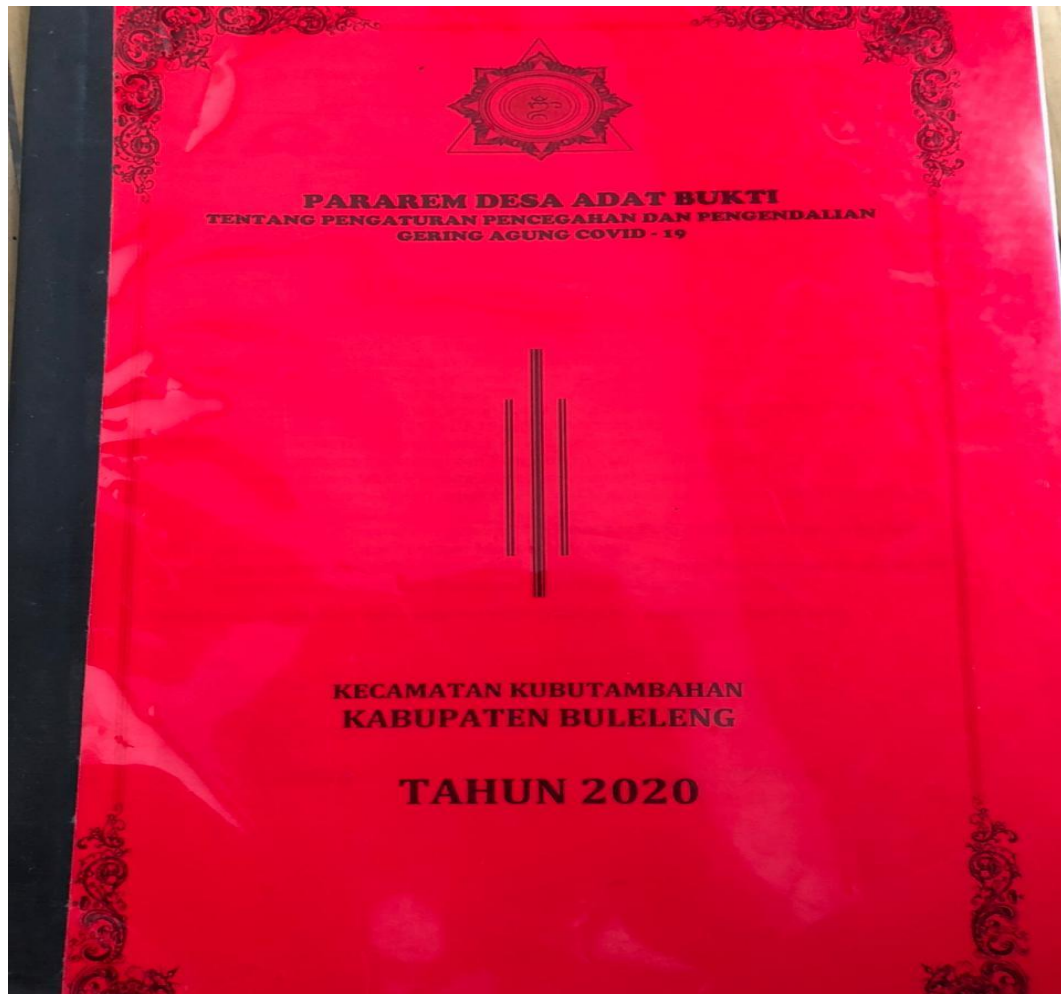
Gambar 1. Pararem Desa Adat Bukti