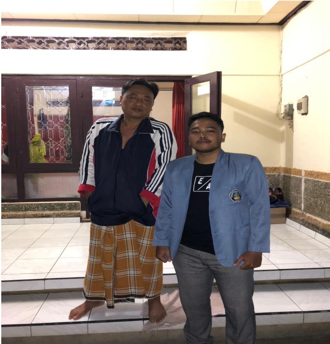
Gambar 1. Observasi dan Wawancara dengan Klian Desa Adat Bukti