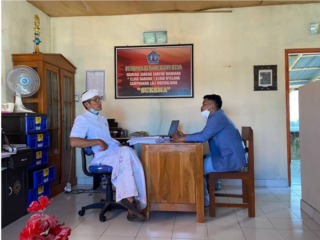
Gambar 2. Observasi dan Wawancara dengan Ketua LPD Desa Adat Bukti