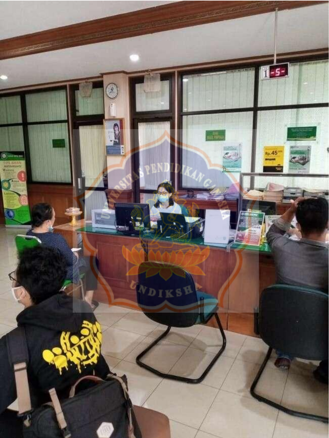
Appendix 1.3 Figure of the writer when conducting the observation on January 4 2021at BPD Bank Singaraja Branch Office