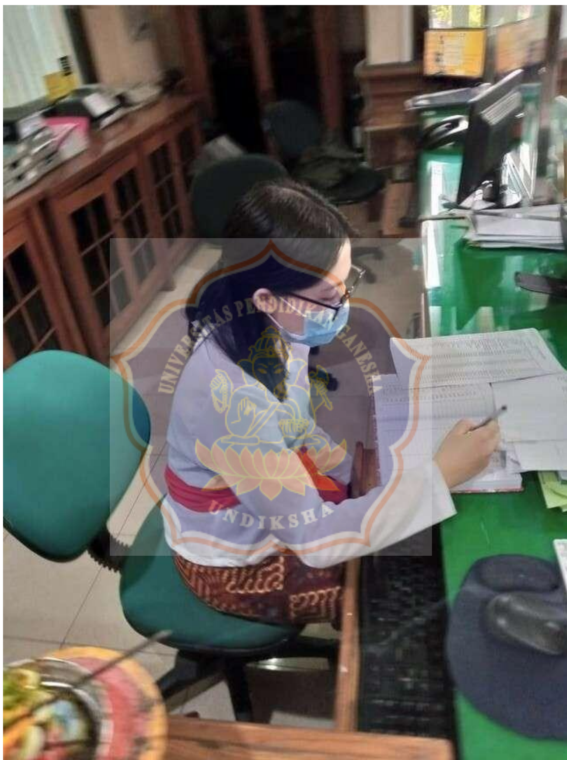
Appendix 1.5 Figure of the writer when conducting the observation on January 112021 at BPD Bank Singaraja Branch Office