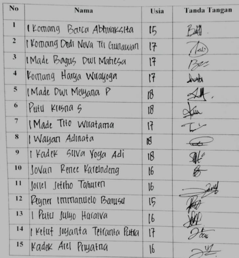
Daftar Peserta MFT Pemain Sepakbola Bali Youth Football 2021