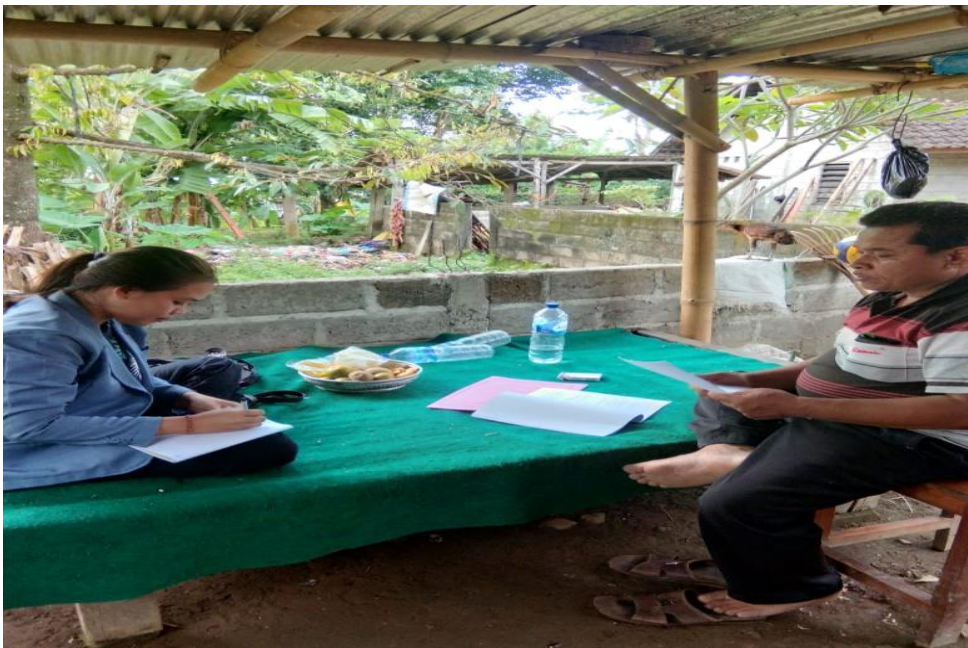
Gambar 01. Foto Bersama Kelian Adat Dusun Pancoran Desa Panji Anom