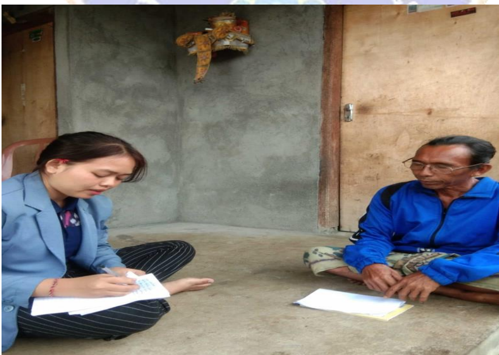
Gambar 02. Foto Bersama Pemangku Adat Dusun Pancoran Desa Panji Anom