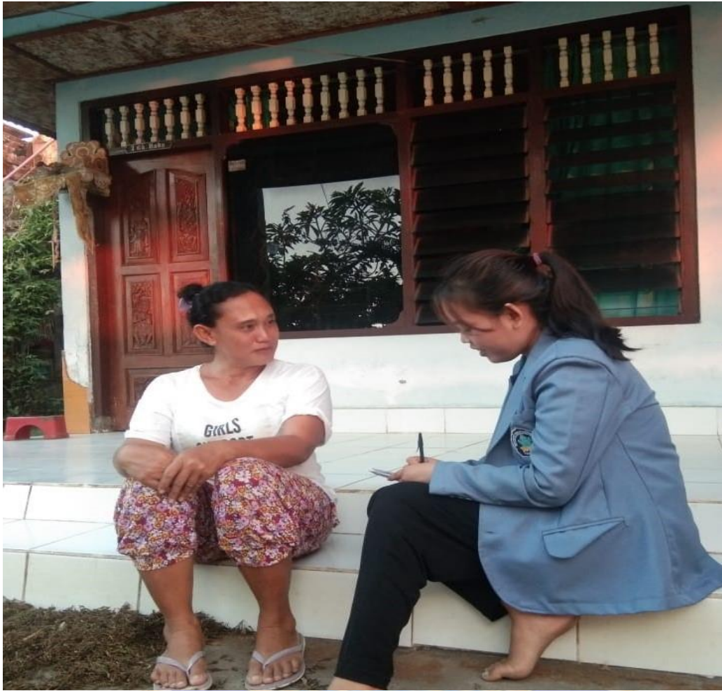
Gambar 03. Foto Bersama Informan