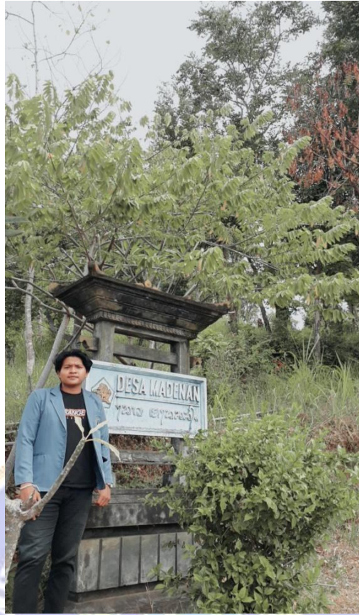
Gambar 7 : Dokumentasi di Tugu Desa Madenan