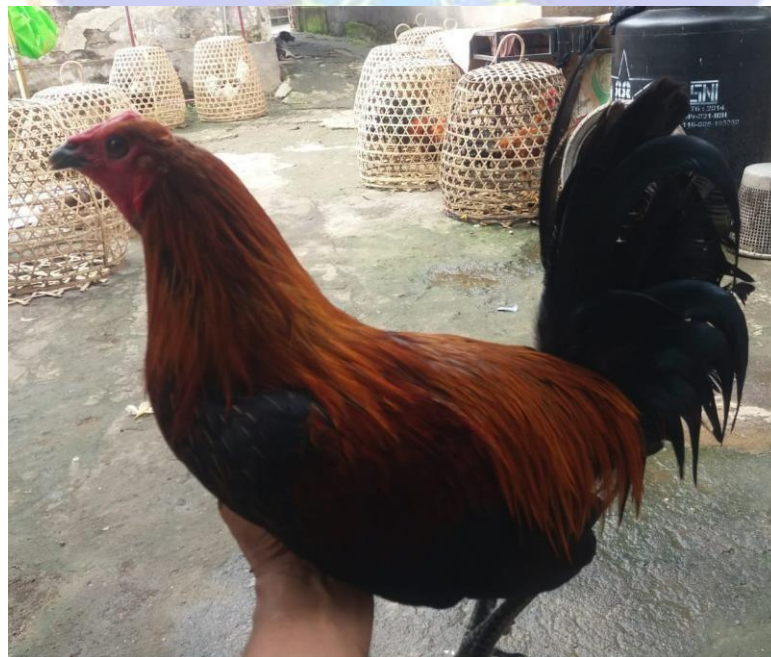
Gambar 6 : Gambar Ayam Yang Memiliki TRAH/SOROH yang Bagus