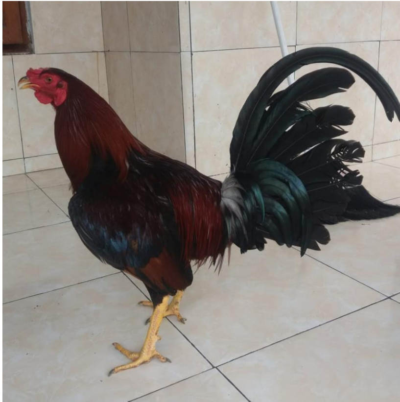
Gambar 5 : Gambar Ayam Madenan yang Memiliki Postur Body yang Bagus