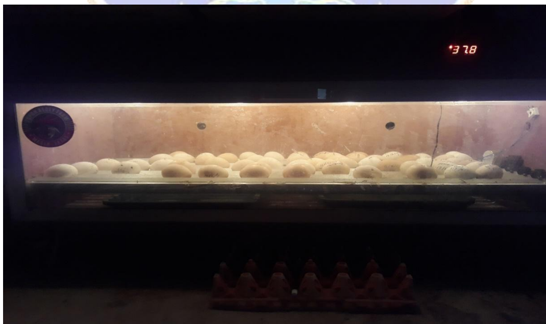
Gambar 4 : Proses penetasan telur ayam madenan