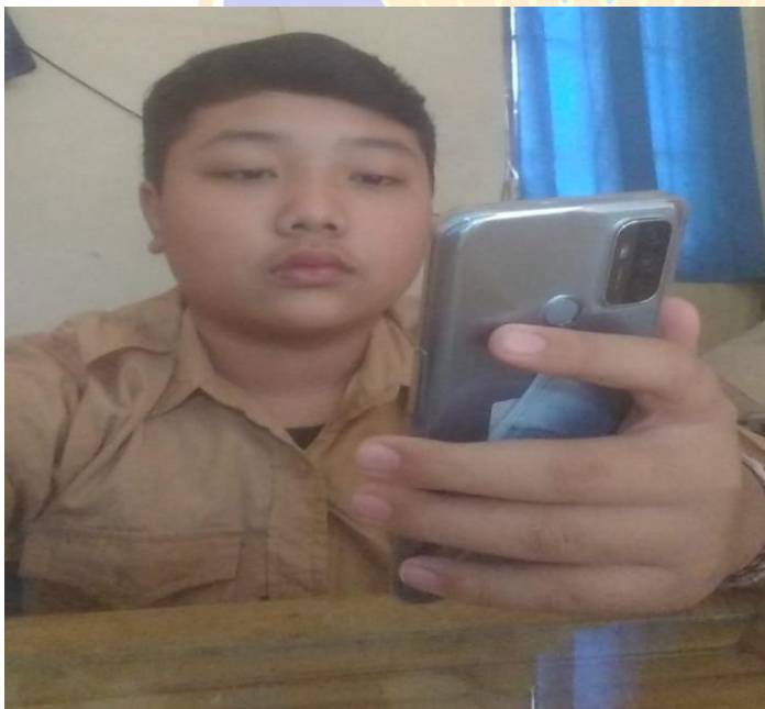
Gambar 2. Mengerjakan Instrumen Kuesioner