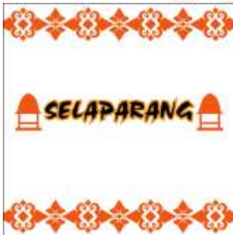
Desain Alternatif Mug ke-1