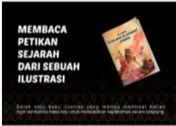
Desain Alternatif Poster ke-1