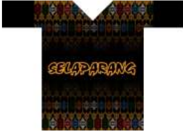
Desain Alternatif Kaos ke-1