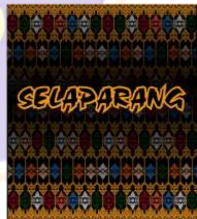
Desain Alternatif Tote Bag ke-3 (Terpilih)