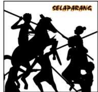
Desain Alternatif Stiker ke-3