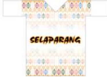
Desain Alternatif Kaos ke-2