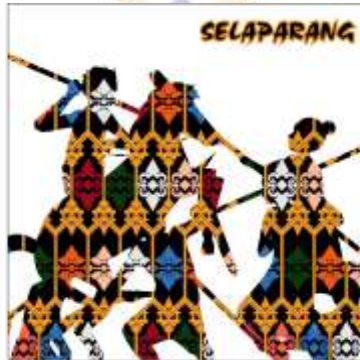
Desain Alternatif Stiker ke-2 (Terpilih)