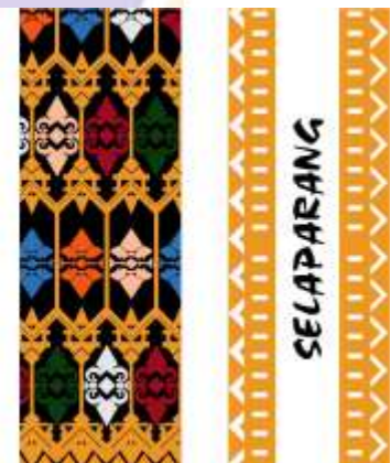
Desain Alternatif Pembatas Buku ke-3