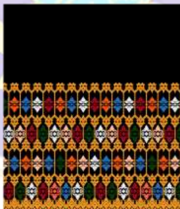
Desain Alternatif Tote Bag ke-2