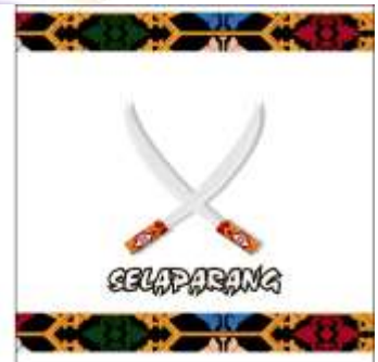
Desain Alternatif Mug ke-3 (Terpilih)