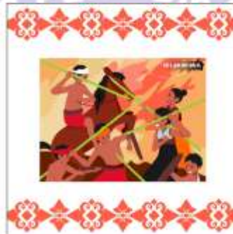
Desain Alternatif Mug ke-2