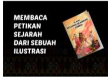
Desain Alternatif Poster ke-2