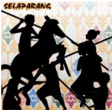
Desain Alternatif Stiker ke-1