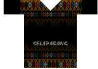
Desain Alternatif Kaos ke-3 (Terpilih)