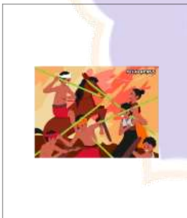
Desain Alternatif Tote Bag ke-1