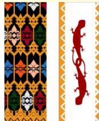
Desain Alternatif Pembatas Buku ke-2 (Terpilih)