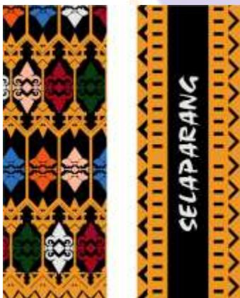
Desain Alternatif Pembatas Buku ke-1