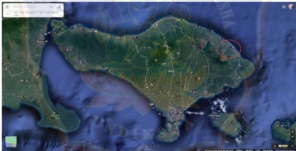
Gambar 1. 1 Peta Pulau Bali

Pemilihan video profile untuk mempromosikan Patung Dewi Danu dianggap mampu meningkatkan jumlah kunjungan wisatawan domestik dan manca negara serta dapat menghemat biaya promosi melalui memanfaatkan media sosial secara gratis. Selain menggunakan media promosi video profile, penyebarluasan informasi tentang Patung Dewi Danu akan ditunjang dengan perancangan media promosi pendukung lainnya seperti logo, brosur, poster, mug, x-banner, t-shirt, dan tiket masuk. Agar promosi dapat dilakukan dengan lebih intensif dan berkesi nambungan menjangkau berbagai lapisan masyarakat.