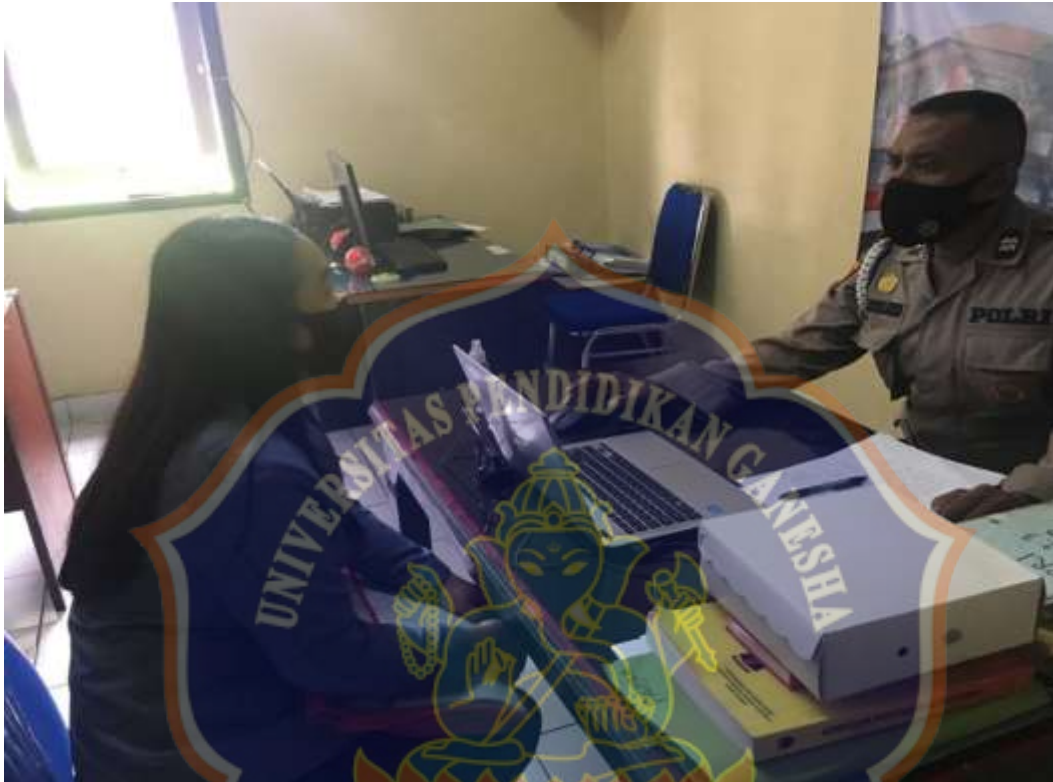
FOTO DENGAN NARASUMBER