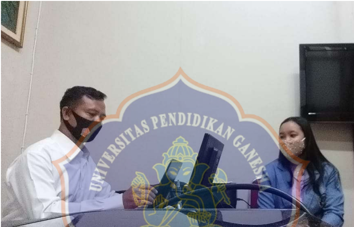
FOTO WAWANCARA DENGAN NARASUMBER