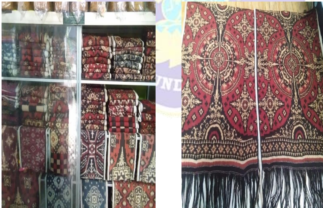
Salah Satu Hasil dari Tenunan Kain Gringsing