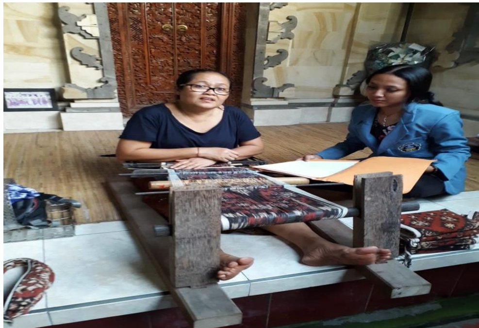
Wawancara dengan pemilik UMKM Tunjung Biru