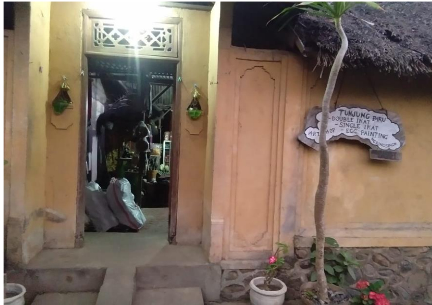
Tempat Usaha UMKM Tunjung Biru