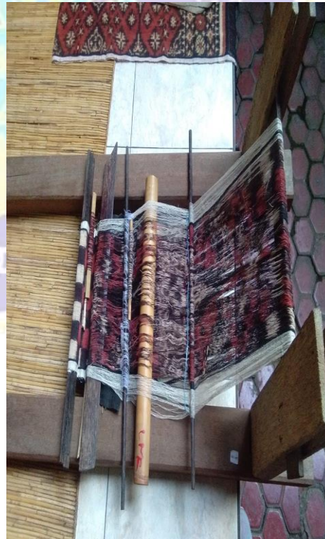
Proses Menenun Kain Gringsing