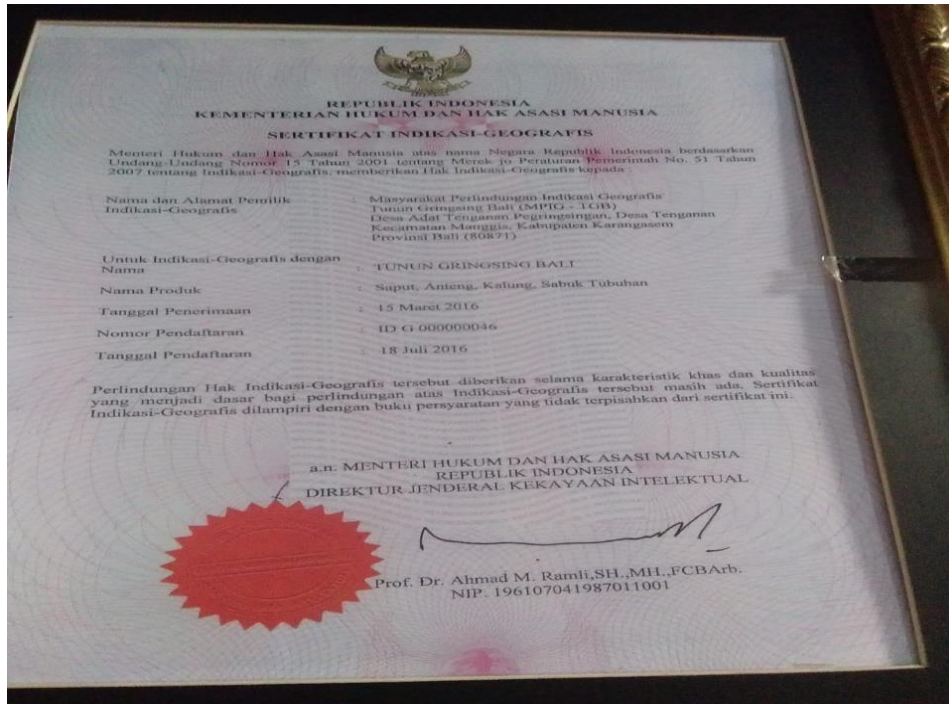
Sertifikat Indikasi Geografis yang diperoleh UMKM Tunjung Biru