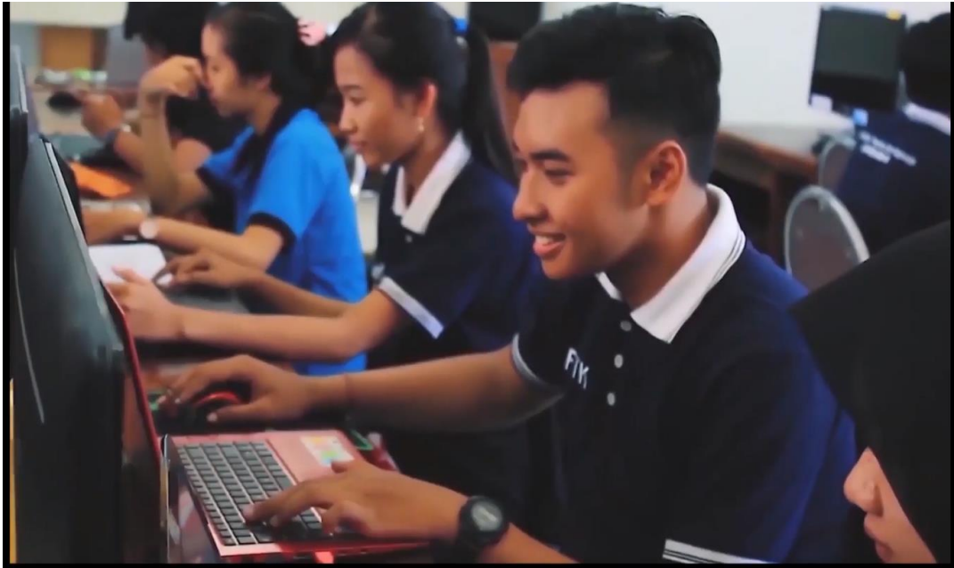
Gambar 5. Menampilkan Lab PTI Dasar