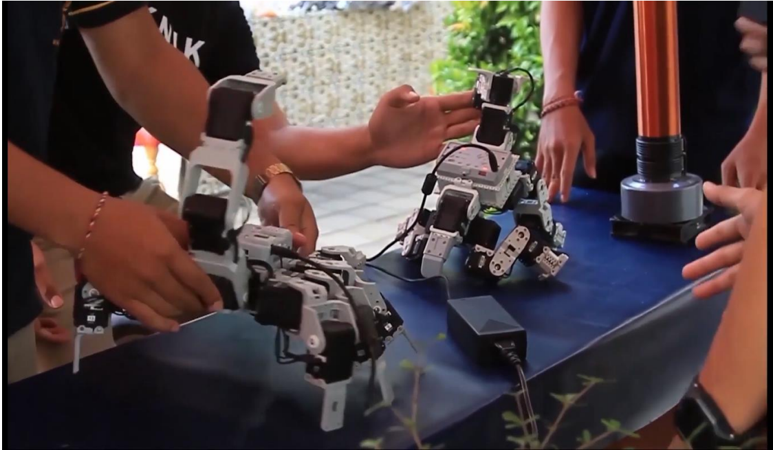
Gambar 15. Menampilkan hasil karya mahasiswa