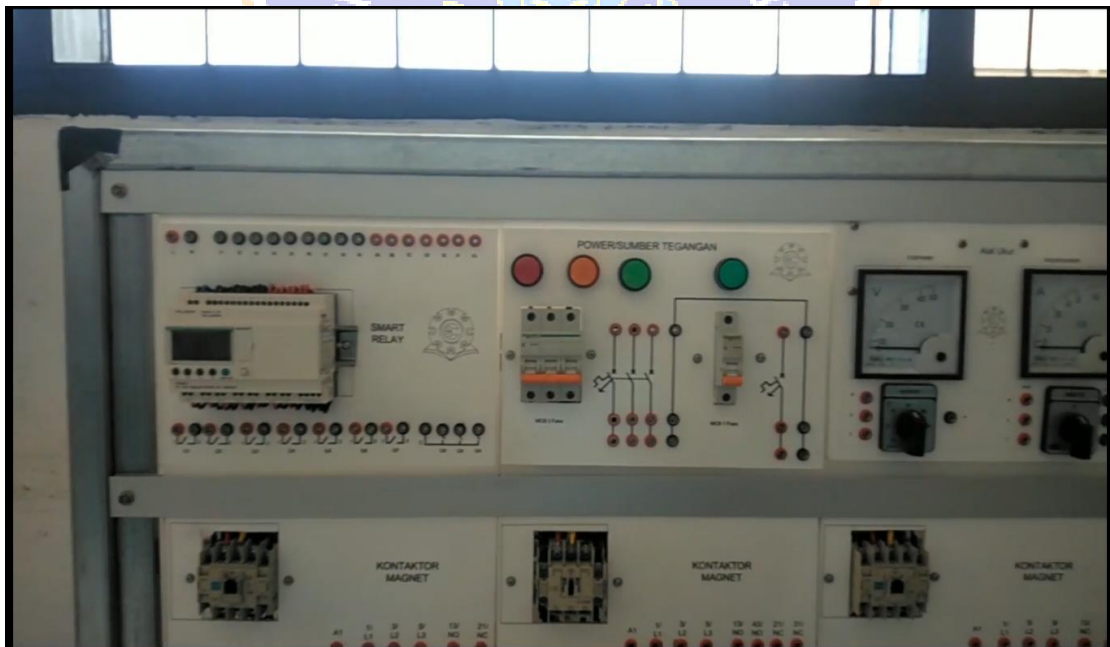
Gambar 10. Menampilkan Alat –alat Lab Elektronika