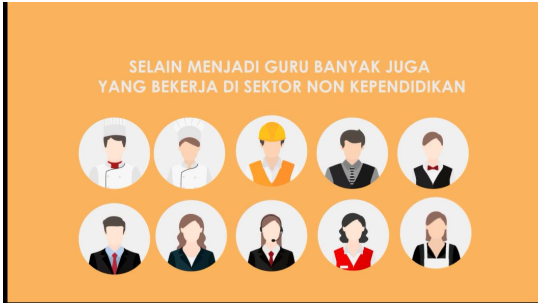
Gambar 3. Menampilkan data infografis gambar 2D