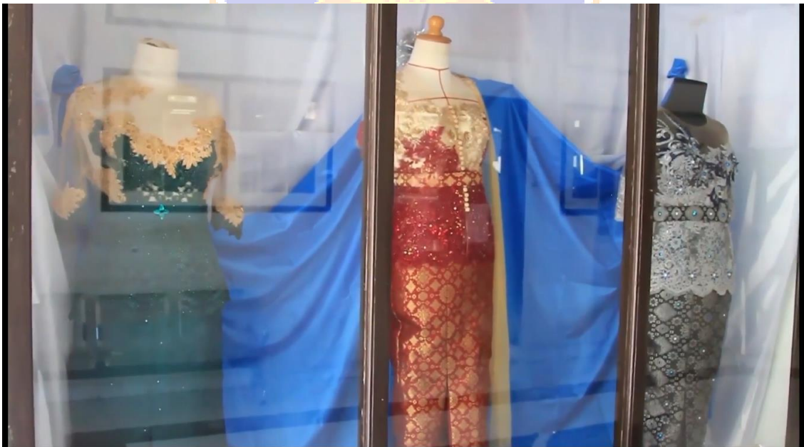
Gambar 16. Menampilkan hasil karya mahasiswa