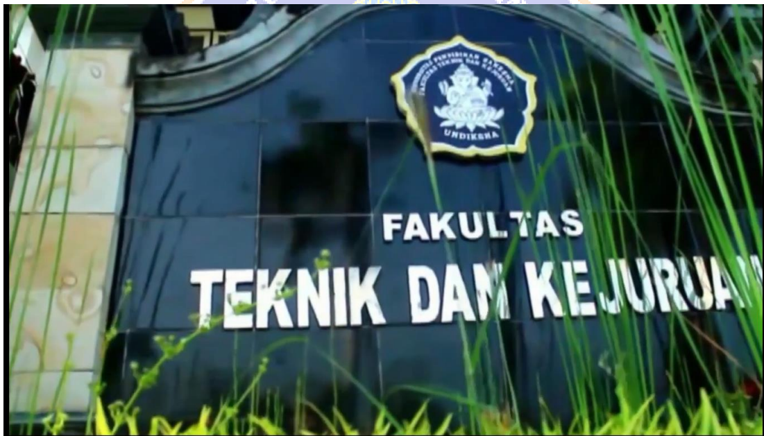
Gambar 2. Menampilkan gedung FTK Undiksha