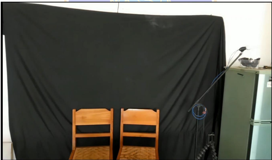
Gambar 12. Menampilkan Alat –alat Lab Multimedia