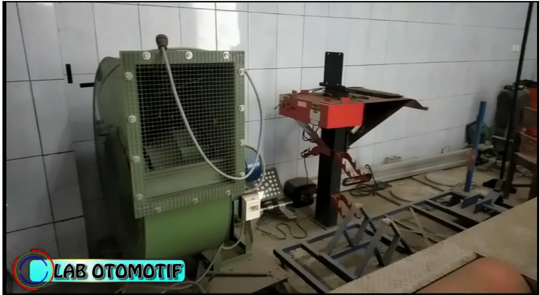
Gambar 13. Menampilkan Lab Otomotif