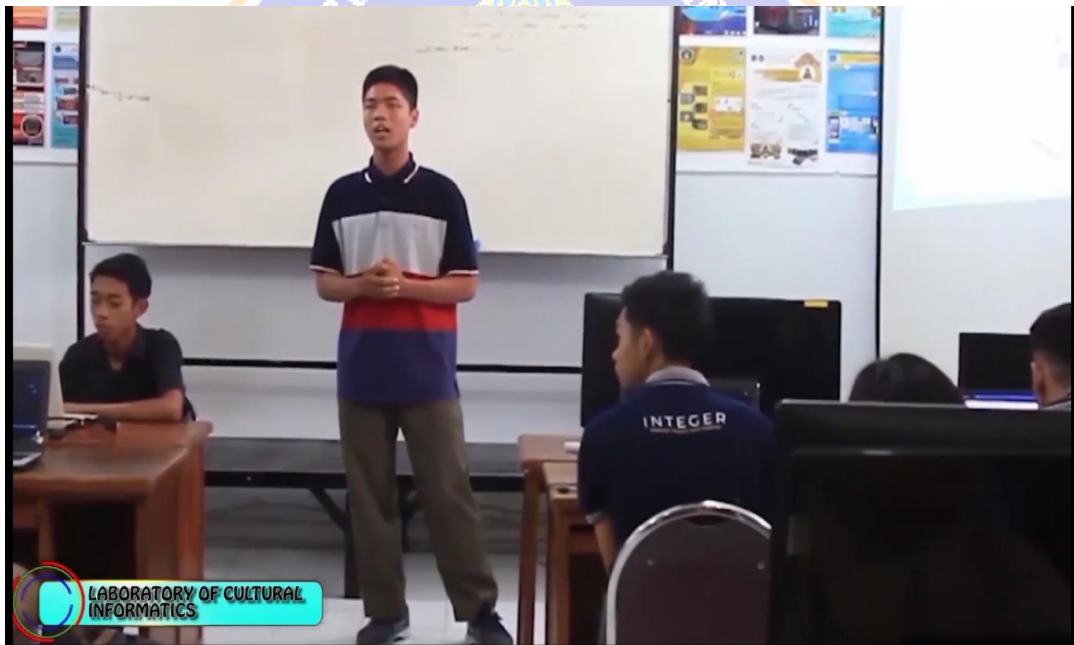
Gambar 6. Menampilkan Lab LCI