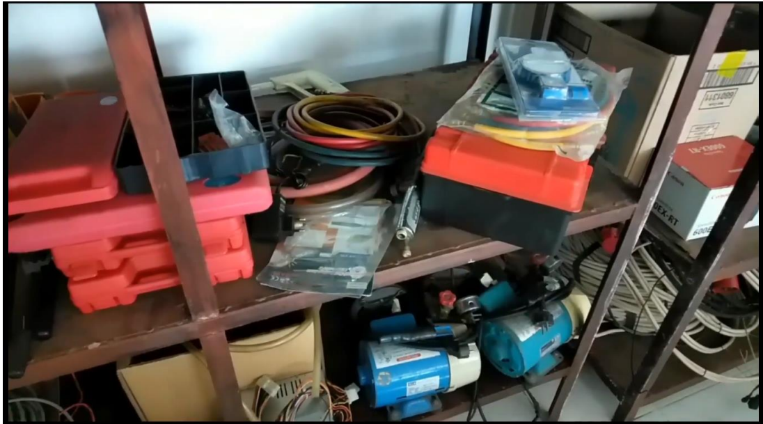
Gambar 9. Menampilkan Alat – Alat Lab Instalasi