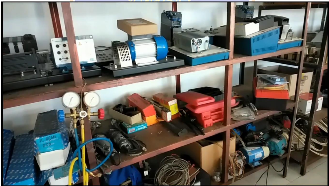
Gambar 8. Menampilkan Alat –Alat Lab Bengkel