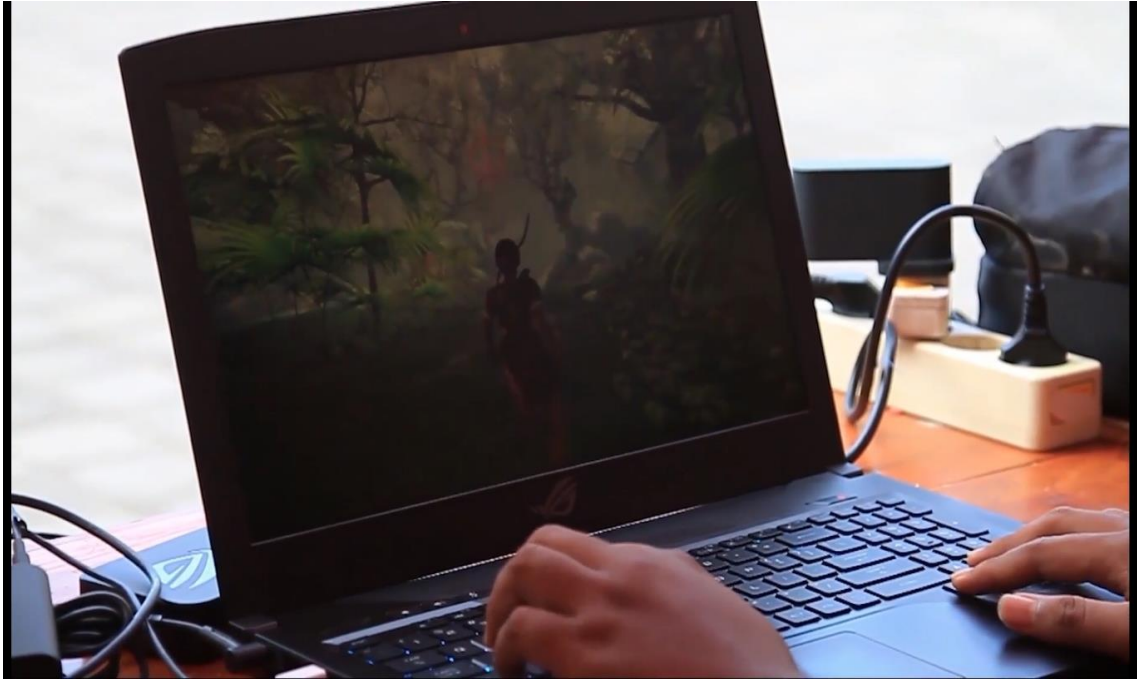
Gambar 17. Menampilkan hasil karya mahasiswa