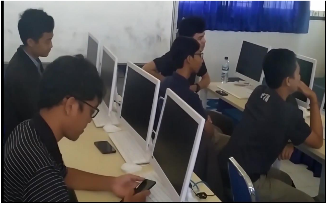
Gambar 7. Menampilkan Lab Sistem Informasi