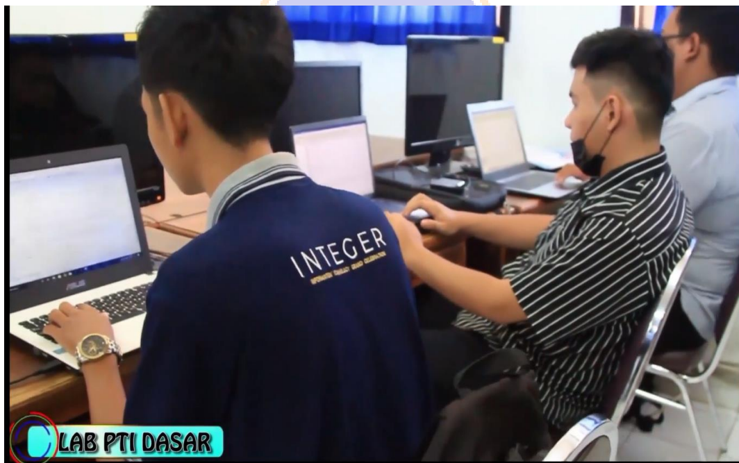
Gambar 4. Menampilkan Lab PTI Dasar