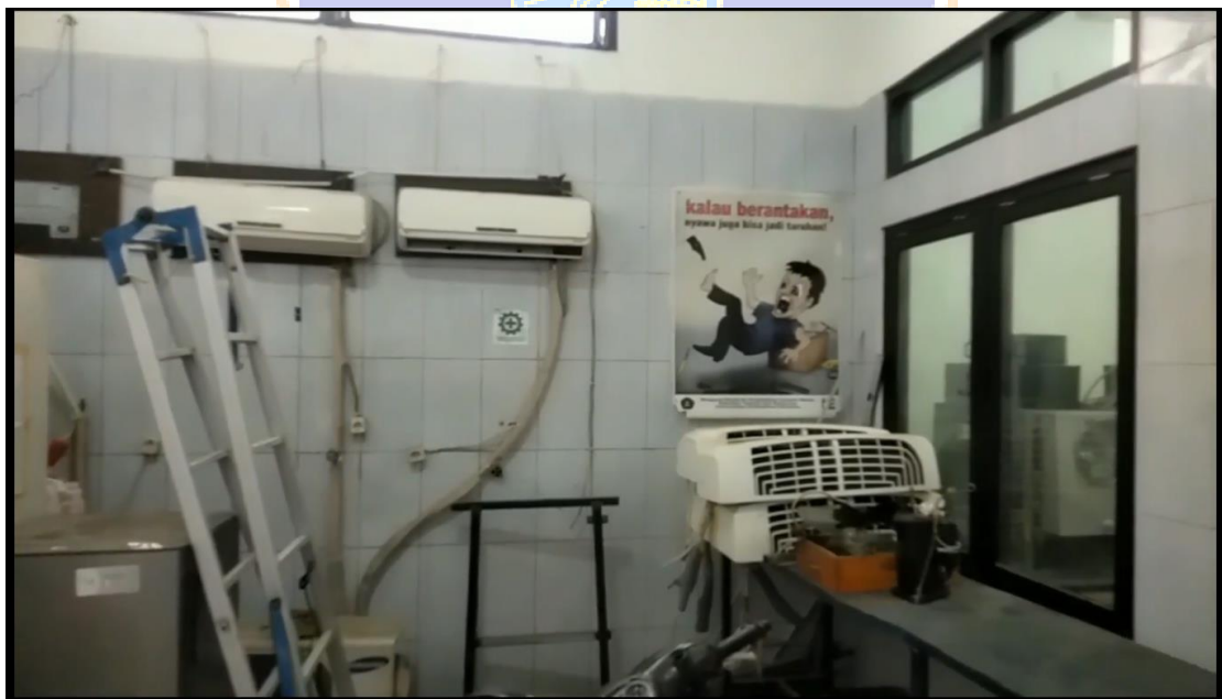
Gambar 14. Menampilkan Lab Pendingin