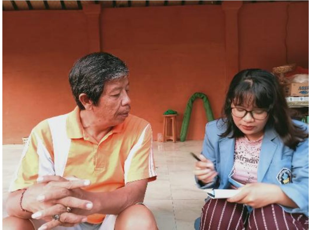
Wawancara dengan Kelian