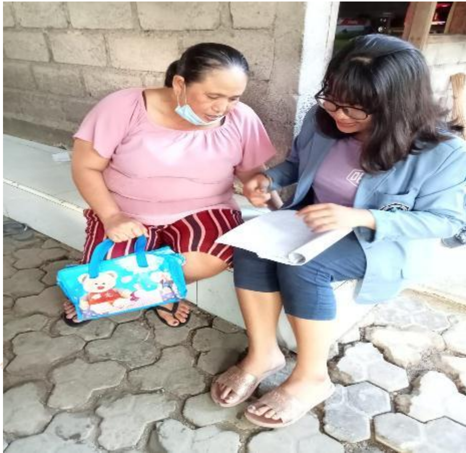
Wawancara dengan krama banjar ngampel