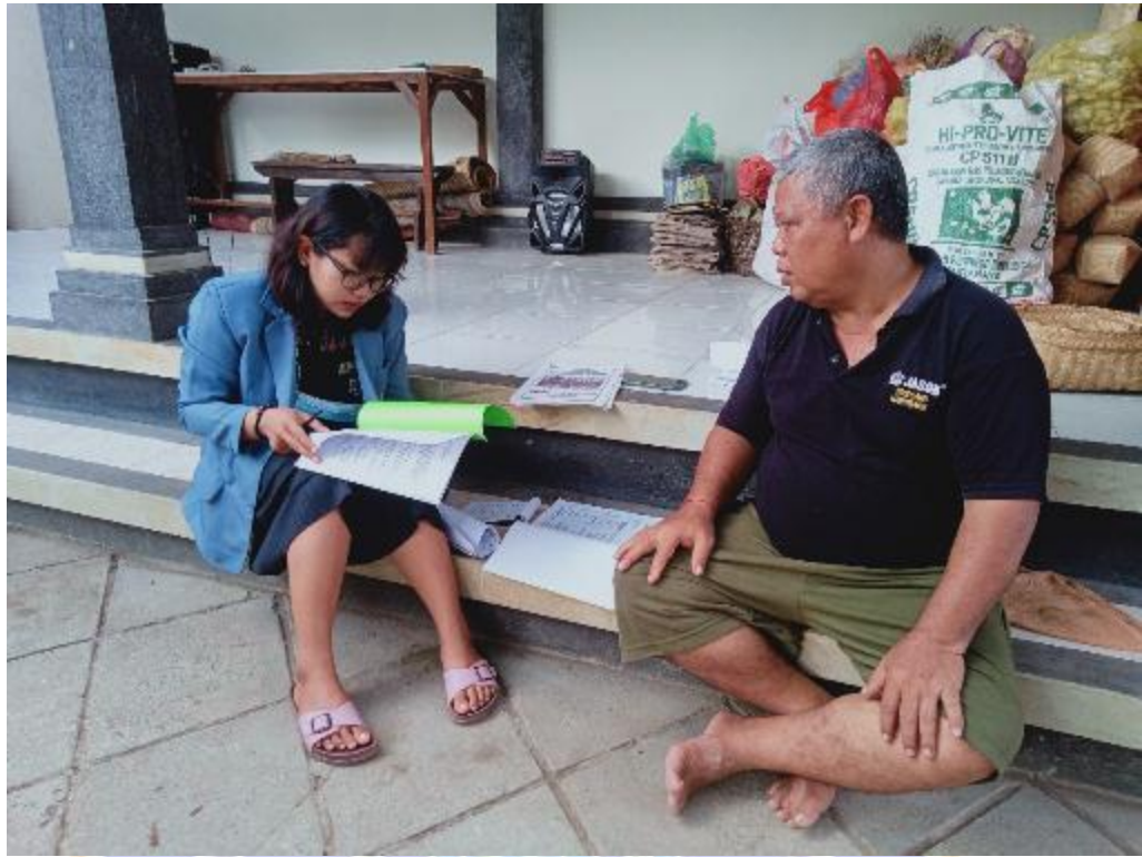
Wawancara dengan Wakil Prajuru