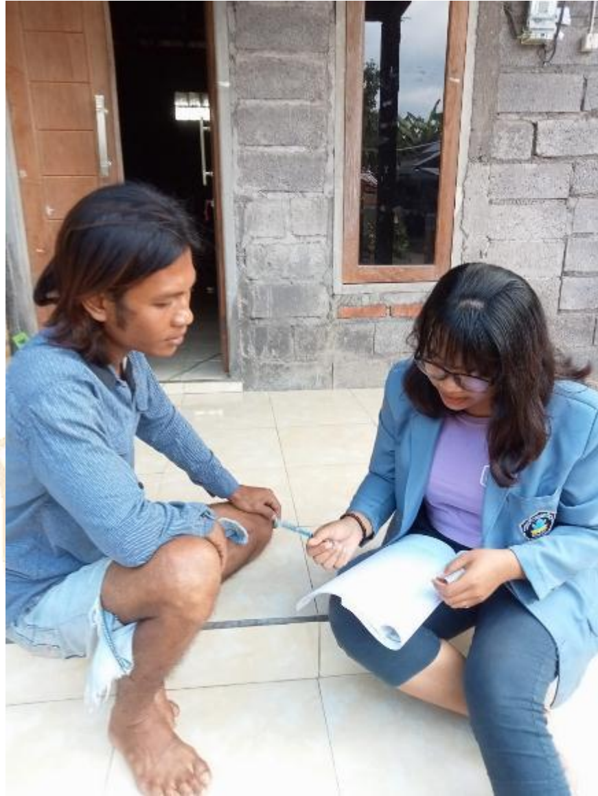
Wawancara dengan krama banjar ngarep