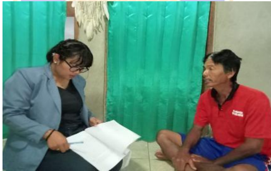
Wawancara dengan krama banjar ngarep