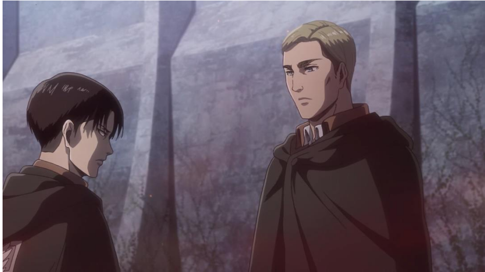
Gambar 04. Levi Ackerman (kiri) yang sedang mendengarkan strategi yang direncanakan oleh Erwin (kanan). Anime Shingeki No Kyojin Season 3 Part 2 episode 04 menit ke 15:06 – 15:23.