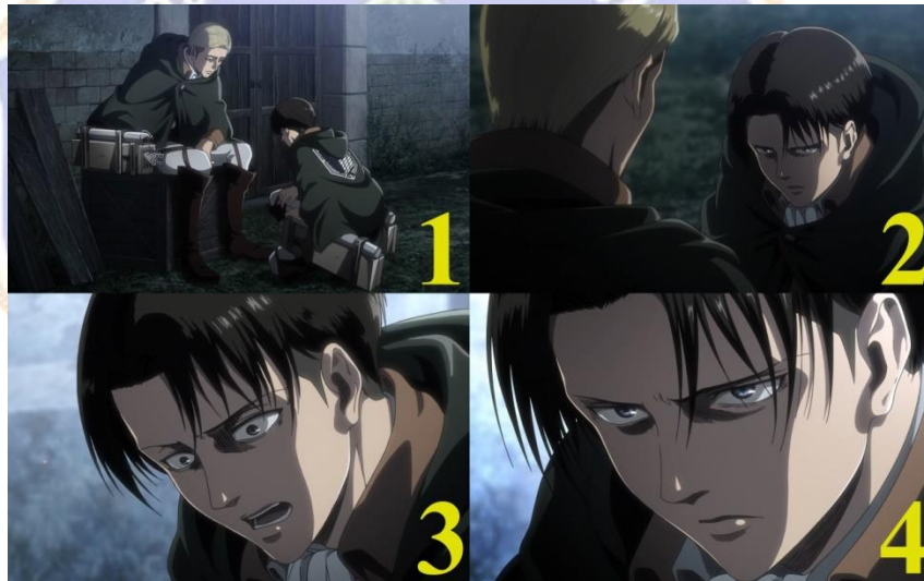
Gambar 05. Levi (kanan) yang bersimpuh dihadapan Erwin (kiri) (1), Levi telah memutuskan pilihannya (2), Levi berbicara kepada Erwin dengan ekspresi wajah marah perihal keputusannya (3), Levi yang telah selesai menyampaikan keputusannya kepada Erwin (4). Anime Shingeki No Kyojin Season 3 Part 2 episode 04 menit ke 17:45 – 18:08.