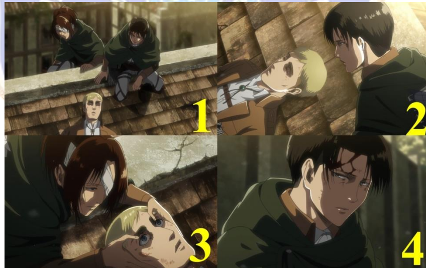
Gambar 09. Hanji (kiri) dan Levi (kanan) menemani Erwin (tengah) disaat terakhirnya (1), Levi (kanan) yang menatap Erwin (kiri) (2), Hanji (kanan) memeriksa keadaan Erwin (kanan) dan menyatakan bahwa Erwin telah gugur (3), Levi yang bersedih dan merasa bersalah (4). Anime Shingeki No Kyojin Season 3 Part 2 episode 06 menit ke 21:14 – 21:45.