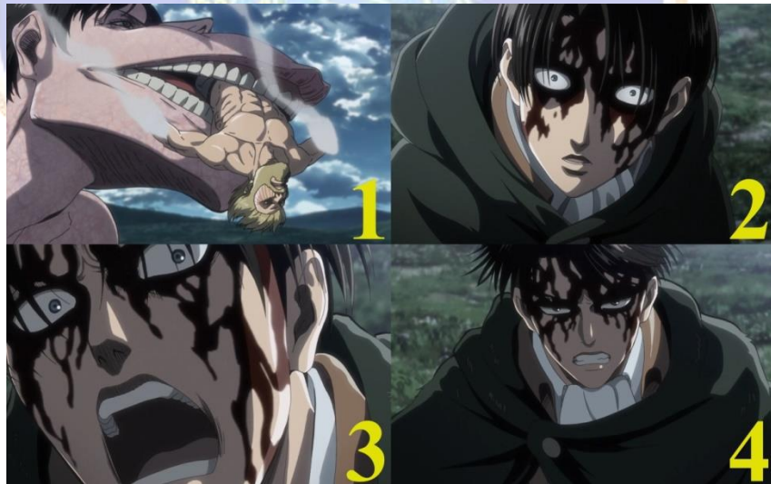
Gambar 07. Pengendali beast titan yang berhasil melarikan diri (1), Levi yang terkejut melihat pengendali beast titan berhasil melarikan diri (2), Levi yang marah karena pengendali beast titan berhasil melarikan diri (3), Levi berusaha mengejar sang pengendali beast titan yang berhasil melarikan diri (4). Anime Shingeki No Kyojin Season 3 Part 2 episode 05 menit ke 04:52 – 06:43.