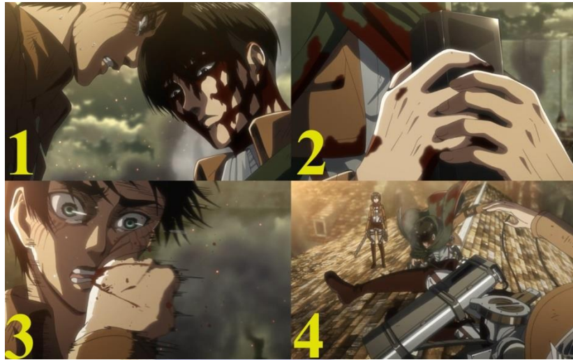
Gambar 08. Eren (kiri) yang menanyakan konsistensi Levi (kanan) dalam mengambil suatu keputusan (1), Eren (kanan) yang berusaha merebut serum dari tangan Levi (kiri) (2), Levi yang marah lantas memukul Eren (3), Eren yang tersungkur terkena pukulan Levi (4). Anime Shingeki No Kyojin Season 3 Part 2 episode 06 menit ke 11:03 – 11:29.