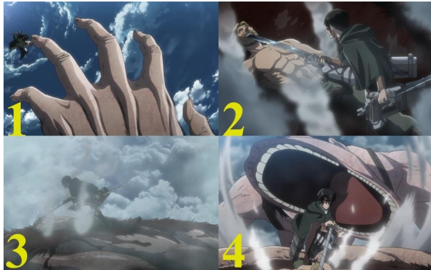
Gambar 06. Levi (kiri) menyerang tangan beast titan (kanan) (1), Levi (kanan) menancapkan pedangnya ke dalam mulut pengendali beast titan (kiri) (2), Levi (kanan) sedang berpikir haruskah dirinya membunuh pengendali beast titan (kiri) sekarang atau nanti (3), Levi (tengah) mendapatkan serangan dadakan dari titan lainnya (atas) (4). Anime Shingeki No Kyojin Season 3 Part 2 episode 05 menit ke 04:52 – 06:43.