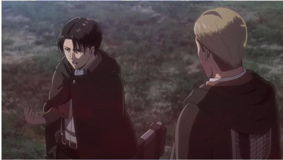
Gambar 03. Levi Ackerman (kiri) yang sedang menjelaskan mengenai strateginya kepada Erwin (kanan). Anime Shingeki No Kyojin Season 3 Part 2 episode 04 menit ke 14:36 – 14:46.