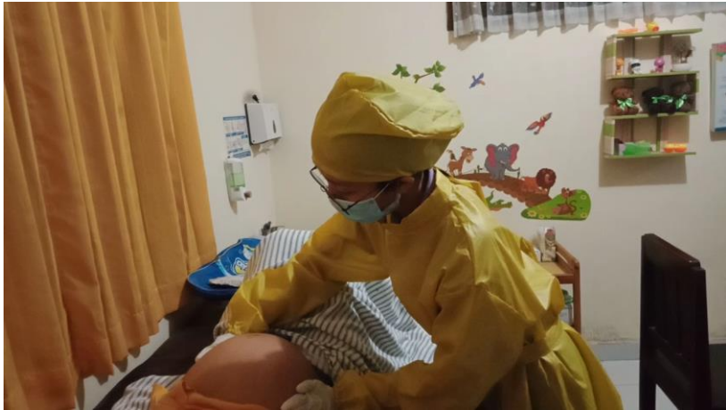
Gambar 2. Melakukan pemeriksaan leopold