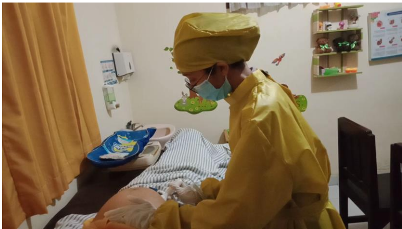
Gambar 3. Melakukan pemeriksaan DJJ.