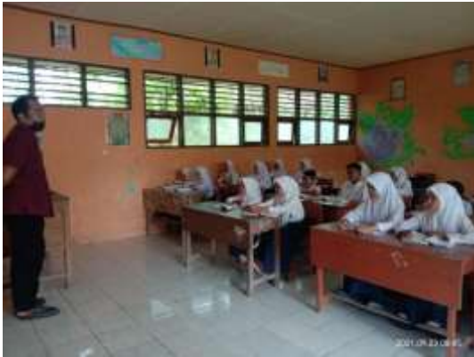
Lampiran 05. Gambar Penelitian/Dokumentasi